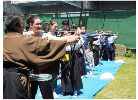
弓道実射体験 (2016.05.05) Kyudo

発行: 公益財団法人 目黒区国際交流協会 Meguro International Friendship Association