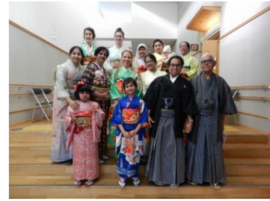
2016.2.7 MIFA 国際交流フェスティバル MIFA Int'l Exchange Festival

発行: 公益財団法人 目黒区国際交流協会 Meguro International Friendship Association