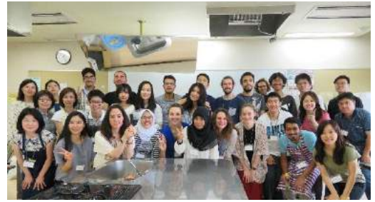
留学生和食交流 7月1日 Japanese cooking class on July 1 th

Meguro International Friendship Association