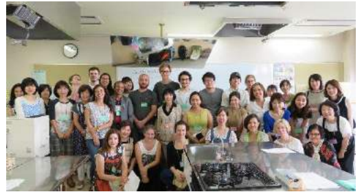
国際料理教室 (日本料理) 5月27日 Japanese cooking class on May. 27 th

発行: 公益財団法人 目黒区国際交流協会 Meguro International Friendship Association