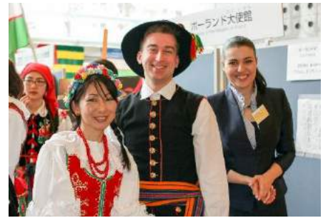
第12回 MIFA 国際交流フェスティバル 12th MIFA International Exchange Festival

発行: 公益財団法人 目黒区国際交流協会 Meguro International Friendship Association