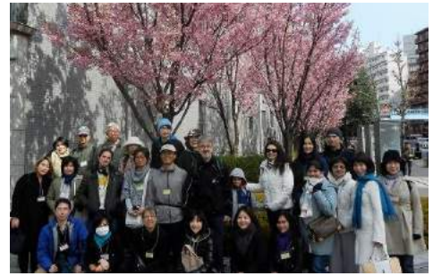
目黒区散策 (目黒の花見散策) Sakura Walk on Mar. 25 th

Meguro International Friendship Association