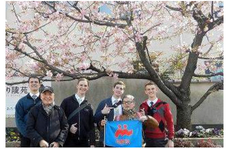
土曜トークカフェ (3月3日) Saturday talk cafe on March. 3rd

発行: 公益財団法人 目黒区国際交流協会 Meguro International Friendship Association