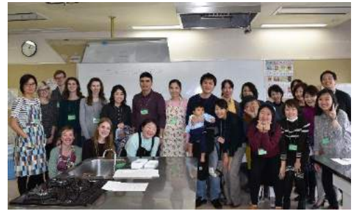
国際料理教室 (日本料理) Japanese cooking class on Feb. 18th

Meguro International Friendship Association