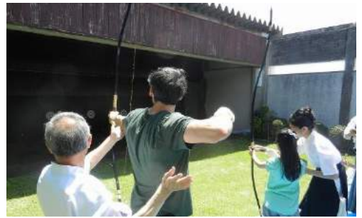
弓道実射体験 Japanese archery on May. 5 th

発行: 公益財団法人 目黒区国際交流協会 Meguro International Friendship Association