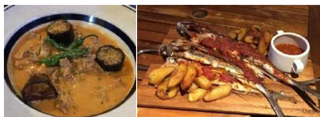
▲振る舞われた料理の品々