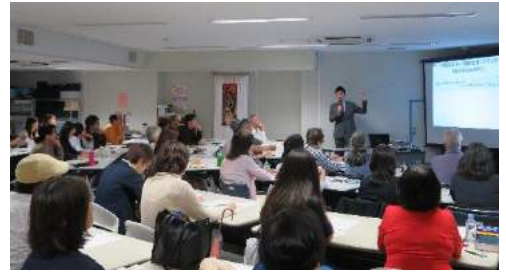
翻訳技術レベルアップ講座 9月2日

発行: 公益財団法人 目黒区国際交流協会 Meguro International Friendship Association